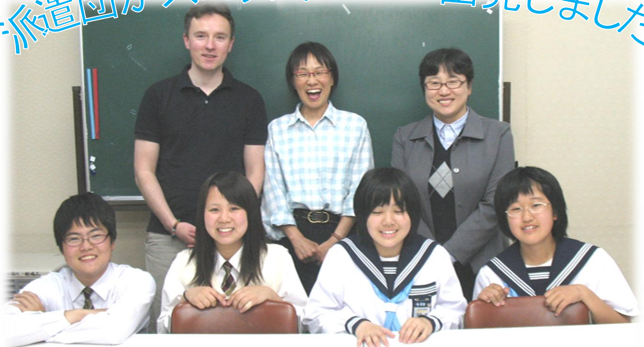
派遣団のみなさん（事前研修講師とともに）

平成23年度九戸村青少年派遣事業派遣団の一行が先ごろ訪問地スコットランドに向けて出発しました。